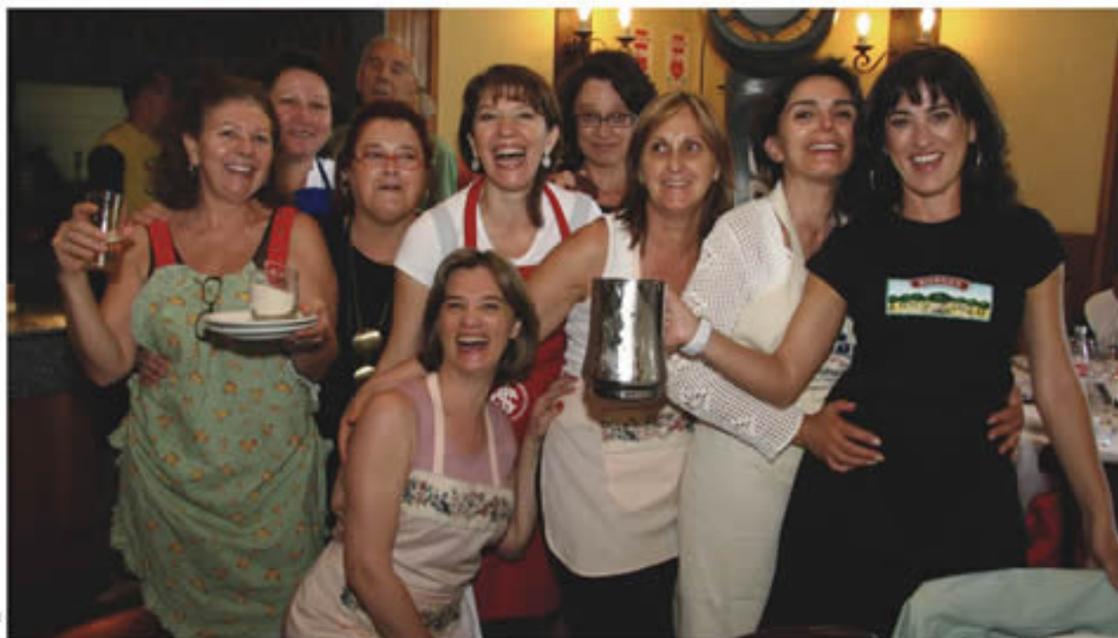
Aposentadas no Almoço de Encerramento da Calcinha