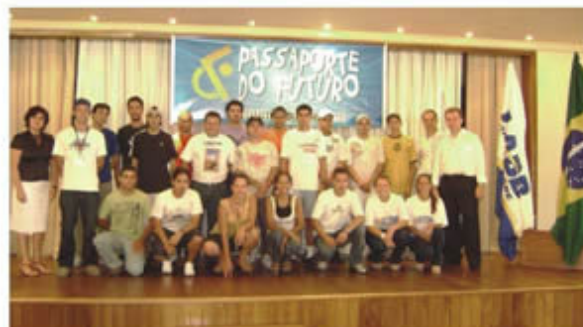
Segunda turma reúne-se na aula inaugural

Construção em Alvenaria, Instalação Hidráulica Predial, Habilidades de Gestão e Segurança, Pintor de Obras e Cidadania e Cultura. A aula inaugural ocorrida em 8 de fevereiro, no Salão de Festas reuniu cinquenta pessoas entre alunos, familiares e parceiros.