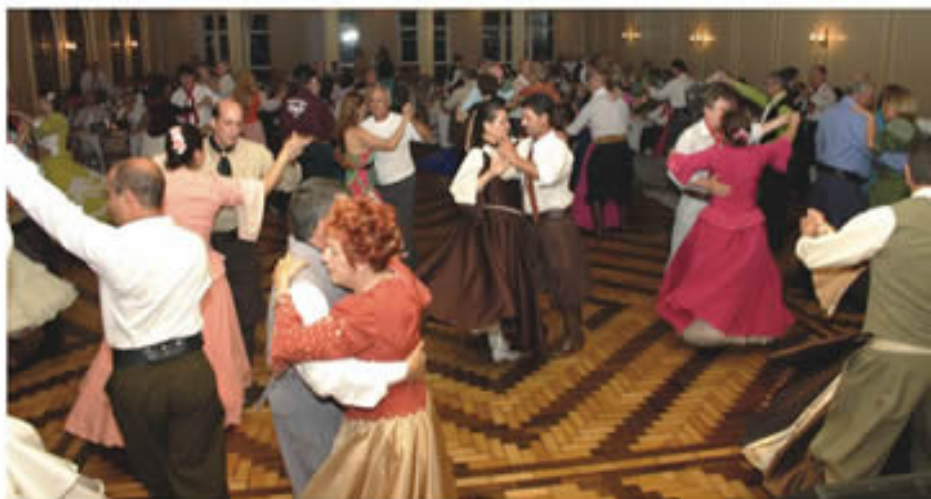
GCG no baile de encerramento das atividades em 2007

O Posto Pedra Redonda, agora sob nova direção, reativou a parceria com a AABB.