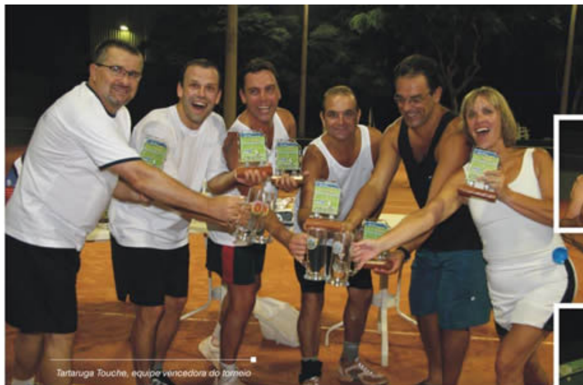
Tartaruga Touche, equipe vencedora do torneio