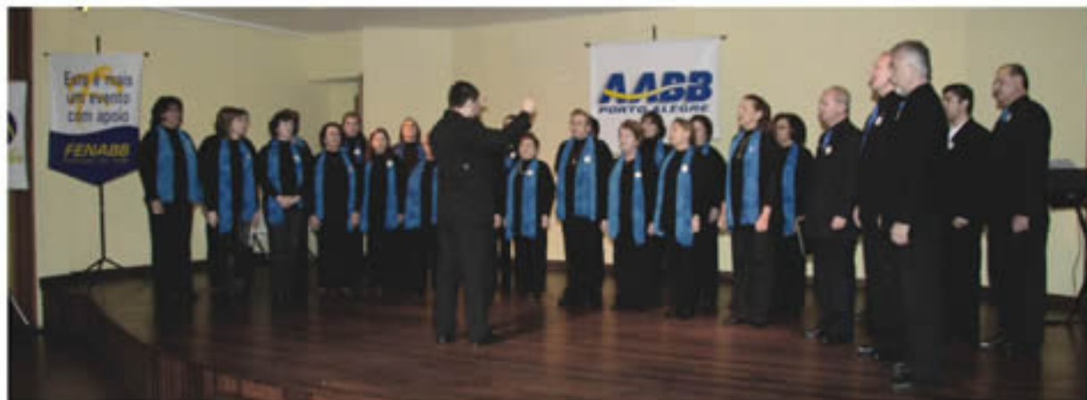
Coral apresenta-se na Semana Cultural