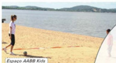
Espaço ABB Kids