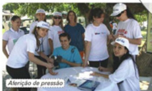
Aferição de pressão

No dia 1º de dezembro, das 9h às 12h, a ABB promoveu mais um Dia da Qualidade de Vida, aberto ao público. Contando com o apoio da SMAM, através do programa Guaíba Vive, do DMAE, da MCM Lonas, da CASSI e da Erva Mate Vier, o evento foi realizado no calçadão de Ipanema, próximo ao banco dos namorados. Foram oferecidas atividades que incentivam o bem-estar e uma vida saudável à comunidade da zona sul porto-alegrense, como caminhada orientada, alongamento, distribuição de água, aferição de pressão e consulta do Índice de Massa Corporal. Cerca de 200 pessoas foram atendidas.