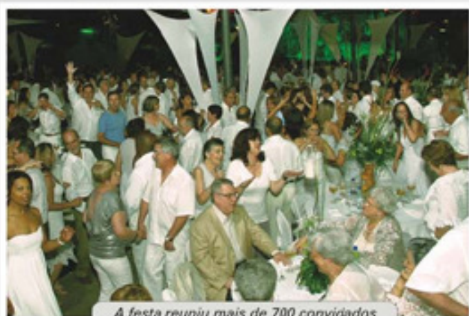
A festa reuniu mais de 700 convidados