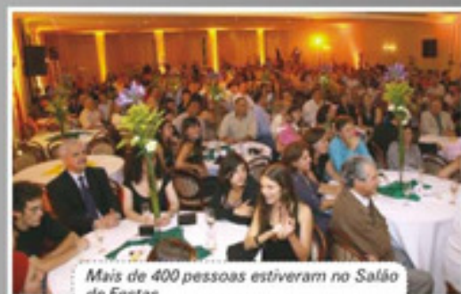
Mais de 400 pessoas estiveram no Salão de Festas