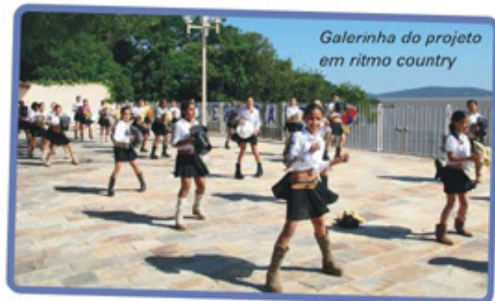
Galerinha do projeto em ritmo country

celebrando os rios, mares, fontes e cachoeiras que nos fornecem tantas riquezas naturais. O estilo country foi o primeiro a destacar a diversidade do nosso povo. Em seguida, a dança do pezinho apresentou o folclore do Rio Grande do Sul. O reggae, o samba, o auto do bumba-meu-boi e o axé representaram as culturas herdadas em diversas regiões do Brasil. A música "Herdeiros do Futuro" emocionou os envolvidos com o projeto, que cantaram em coro "Vamos ter que cuidar bem deste país" e encerrou com chave-de-ouro as ações deste ano.