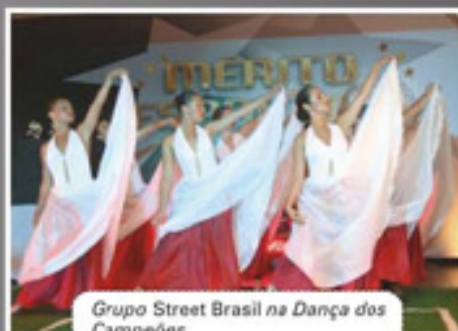
Grupo Street Brasil na Dança dos Campeões