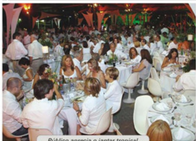
Público aprecia o jantar tropical

Recuperação de Dores da Coluna, Tendinites, Lesões do Esporte, Atrose e Reumatismo.