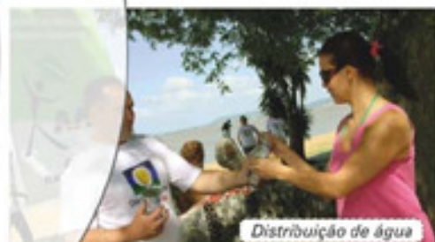
Distribuição de água