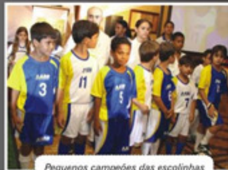
Pequenos campeões das escolinhas