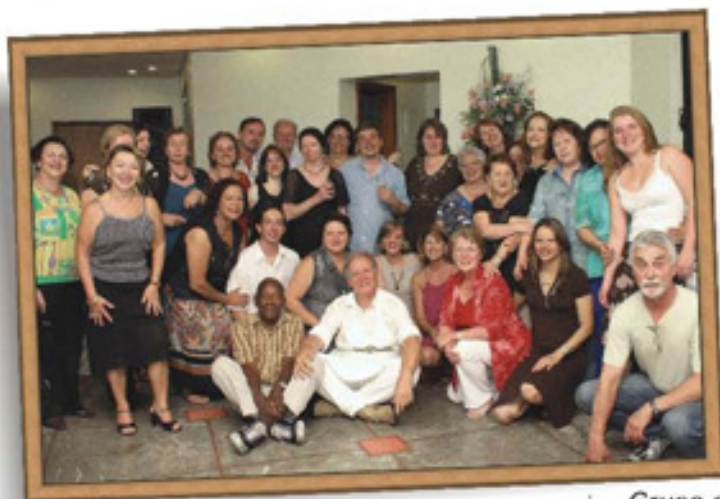
Grupo completo do Coral no jantar de encerramento

Já no dia 11 de dezembro, às 20h30min, nosso coral participou de uma emocionante confraternização com os familiares da PACTO, no Salão Paroquial da Igreja Sagrada Família, marcando de forma especial o término das apresentações deste ano.