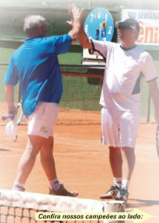
Confira nossos campeões ao lado:

Cerca de 80 amantes do esporte inscreveram-se na competição, que, como de praxe, contou com uma cerimônia especial de premiação, seguida do almoço de confraternização, que marca o término do evento.