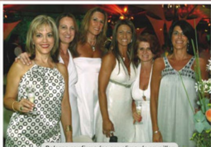
Belezas confirmadas em clima de reveillon