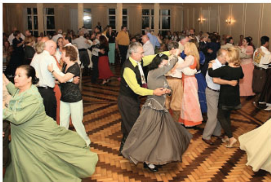
A dança faz parte da festa

Abrindo as comemorações da tradicional Semana Cultural abebeana, acontecerá, no dia 18 de julho, a partir das 21h, no Salão de Festas do Clube, o tão esperado encontro do GCG Rancho Posteiro, que na edição deste ano ganhou título especial: Baile à Gaúcha "Acampamento Farroupilha".