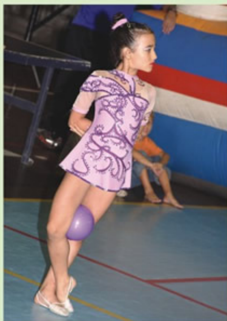
Banco de imagem

As aulas ocorrem nas segundas e quartas-feiras, às 10h e às 14h.