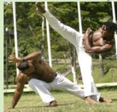
Banco de imagem

Vale lembrar que a AABB possui outras atividades físicas disponíveis. Quem desejar mais informações sobre essas e outras modalidades deve entrar em contato pelo telefone (51) 3243.1021 ou acessar o site www.aabbportoalegre.com.br .