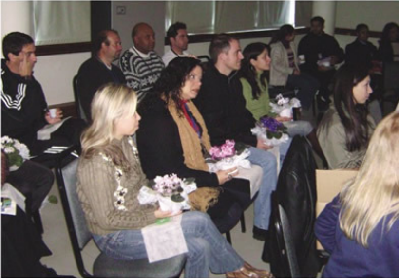
Colaboradores receberam flores para celebrar a data

Difundindo suas práticas socioambientais e pensando em contribuir para a qualidade de vida dos associados, colaboradores e da comunidade em geral, a AABB Porto Alegre realizou, no dia 5 de junho, ações comemorativas ao Dia Internacional do Meio Ambiente. A manhã foi repleta de atividades especiais, que marcaram também o primeiro aniversário do Comitê de Responsabilidade Socioambiental. Na oportunidade, foi apresentada a campanha de incentivo e conscientização das ações sociais e ambientais, exposições fotográficas com imagens sobre aquecimento global, atividades realizadas pelo comitê e dois vídeos sobre as temáticas. O evento também reservou momentos de interatividade, com a brincadeira dos envelopes-surpresa, que eram retirados debaixo das cadeiras dos convidados. Os cartões com curiosidades sobre a preservação ambiental também serviram de números para os sorteios de brindes, que premiou mais de dez participantes com ECO BAGS, camisetas da campanha e uma árvore da felicidade. Além disso, o público aproveitou o coffee break para confraternizar e se deliciar e, claro, fazer o bem-estar acontecer na AABB.