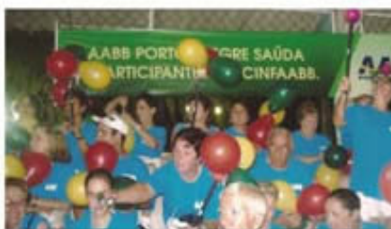
XIV CINFAABB de Maceió A torcida campeã em ação.