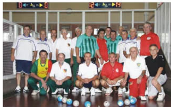
Integração das equipes no Aberto de Bocha

O congresso técnico sorteou as chaves classificatórias. A final do Torneio foi disputada entre AABB e Gonzaga, e por 15 pontos a 13 a equipe pelotense, uma das melhores do Estado, levou a taça. Para marcar o encontro, um jantar foi oferecido pela AABB aos participantes.