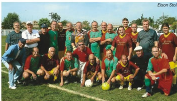
A amizade também entra em campo