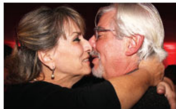
O amor estava no ar

Com ingressos esgotados, o evento confirmou seu sucesso e proporcionou aos pombinhos e apaixonados momentos de carinho, diversão e, é claro, muito amor.