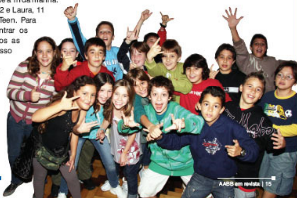
A gurizada curtia a festa

A novidade para a gurizada é o perfil oficial do Clube no site de relacionamento Orkut. Além do site da AABB, as fotos da galera estarão disponíveis também no perfil do Clube no Orkut. Quem quiser conferir, basta procurar por AABB Porto Alegre e aguardar a próxima edição da Festa.