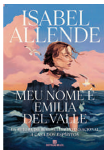
Meu nome é Emilia Del Valle Isabel Allende