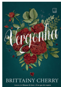
Vergonha Brittainy Cherry