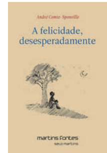
A felicidade, desesperadamente André Comte-Sponville