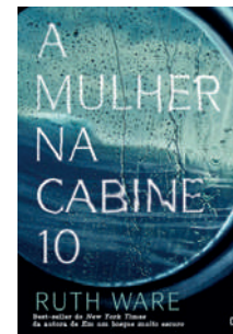
A mulher na cabine 10 Ruth Ware