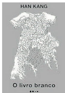
O livro branco Han Kang