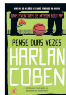
Pense duas vezes Harlan Coben