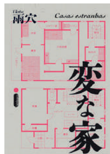
Casas estranhas Ukestu