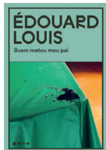
Quem matou meu pai Édouard Louis