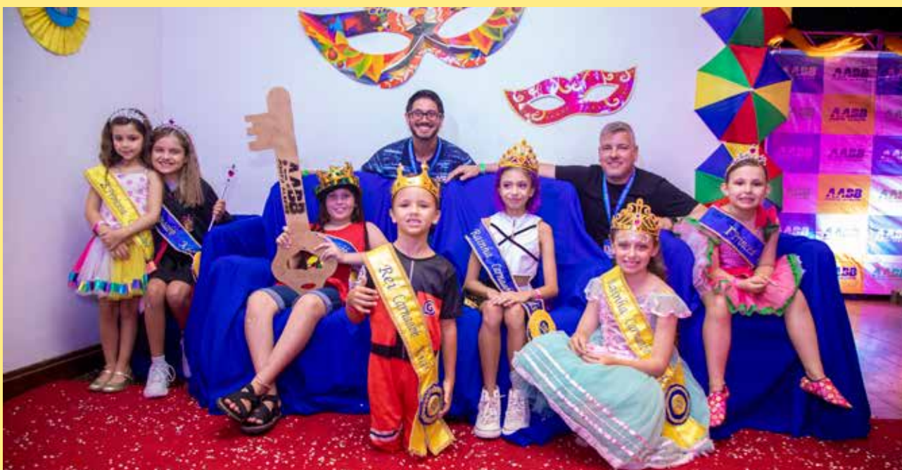
A Corte 2026 está trajada com a faixa identificada na cor azul, enquanto a Corte 2025 está usando a faixa amarela.