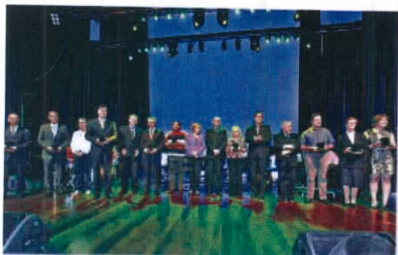
do Prmo de Responsabilidade Social em 13. Lan- s sociais com a RS 2013 em relao: hnterajorn

O Trofeu de Responsabilidade Social - Destaque RS, nas categorias especificadas, ser concedido as organizaes que apresentarem, em cada categoria, o melhr nvel de desempenho em termos de responsabilidade social, em avaliao procedida a partir do balan- s social e do relatrio de responsabilidade social apresentadas e desde que no tenham sido agraciadas com o referido trofeu nas ultimas duas edies desta premiao.