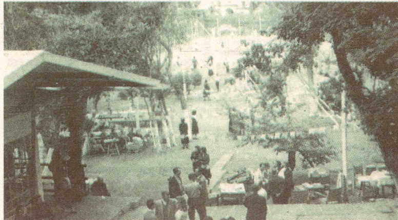
Fotos do acervo da entidade mostram estrutura nos primeiros anos: quando inaugurado, na década de 50, o clube aceitava apenas funcionários do Banco do Brasil

Aos poucos, foi crescendo, de associação exclusiva de funcionários do Banco do Brasil a clube aberto, primeiramente a parentes de funcionários e mais tarde à comunidade, que democratizou o corpo social da entidade, proporcionando um crescimento maior e mais sólido. Nas décadas que seguiram a fundação do clube, anos 50, 60, 70 e 80, somente funcionários do Banco do Brasil poderiam associar-se. O banco proporcionou, em várias gestões da associação, condições