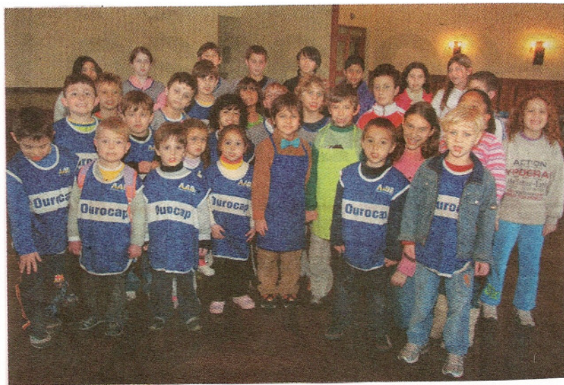
OSÉ PADILHA, DIVULGAÇÃO