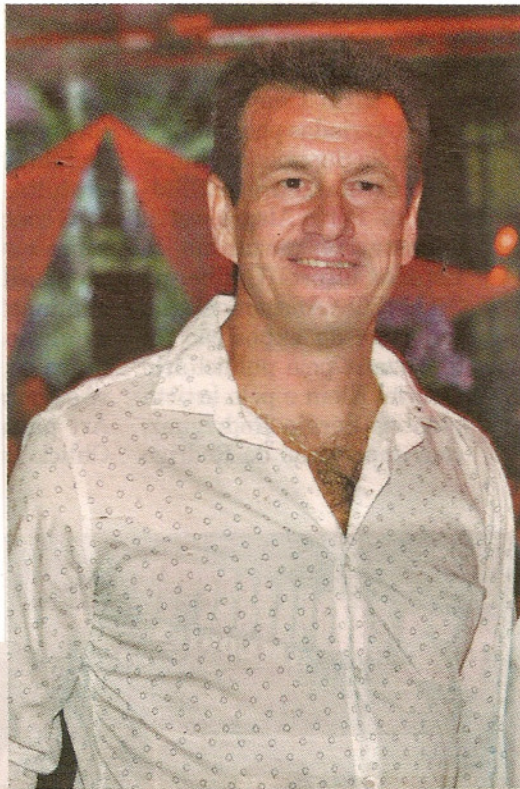
O técnico Dunga, na Associação Atlética Banco do Brasil