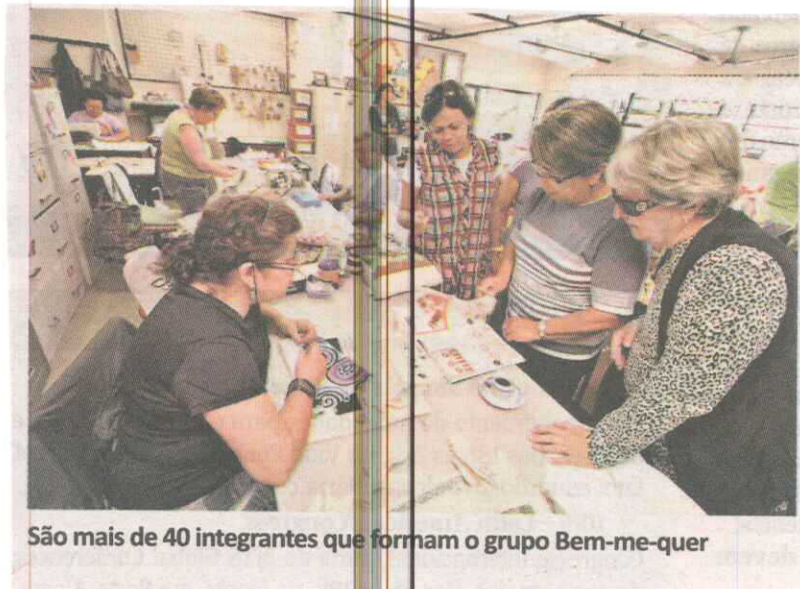
São mais de 40 integrantes que formam o grupo Bem-me-quer