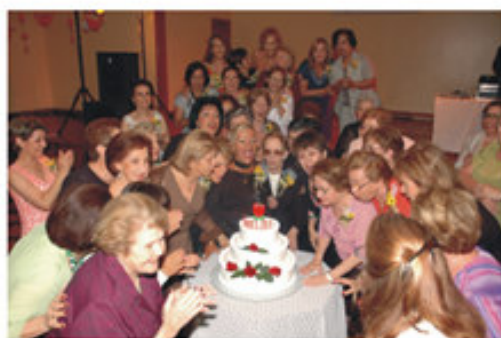
Comemoração de dez anos de existência do Bem-Me-Quer