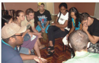
Dinâmica de grupo durante visita ao Clube.

Lançado em 6 de outubro de 2006, o projeto tem parceria com o Instituto Cooperforte e pretende proporcionar para jovens entre 17 e 22 anos suporte de ensino e capacitação para enfrentar o mercado de trabalho. O projeto tem como parceiros o SENAC RS, o Banco do Brasil e a Corlac. O curso profissionalizante oferecido aos 31 jovens é voltado para as áreas administrativa, contábil e logística. A iniciativa é uma oportunidade de a juventude em risco social poder competir no atual mercado de trabalho. O curso tem duração média de seis meses e é dividido em dois módulos. No primeiro, os jovens tiveram 360 horas/aula, no período da tarde, ministradas pelo SENAC. Já no segundo módulo, os alunos poderão colocar em prática o aprendizado teórico, através da efetiva atuação em empresas clientes do Banco do Brasil. Vale lembrar que para a realização do curso os jovens recebem ainda auxílio no transporte e na alimentação. Ao final dos dois módulos, o jovem terá a qualificação de Assistente em Serviços Administrativos, com diploma assinado pelo SENAC e pela AABB Porto Alegre.