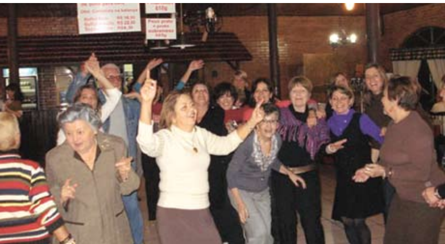
Descontração dos que estavam no jantar da Vani

É chato dizer, mas o passeio a Gramado foi um sucesso, como sempre. No futebol, não perdemos: foram dois empates e o velho