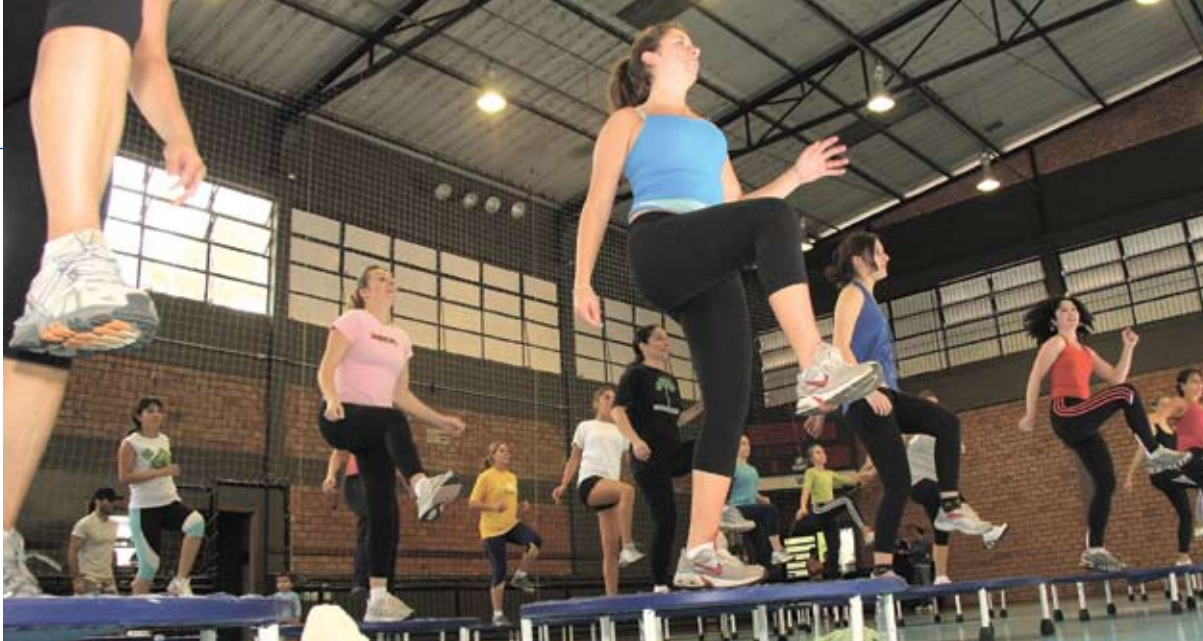
Maratona de Ginástica fez todo mundo suar a camisa