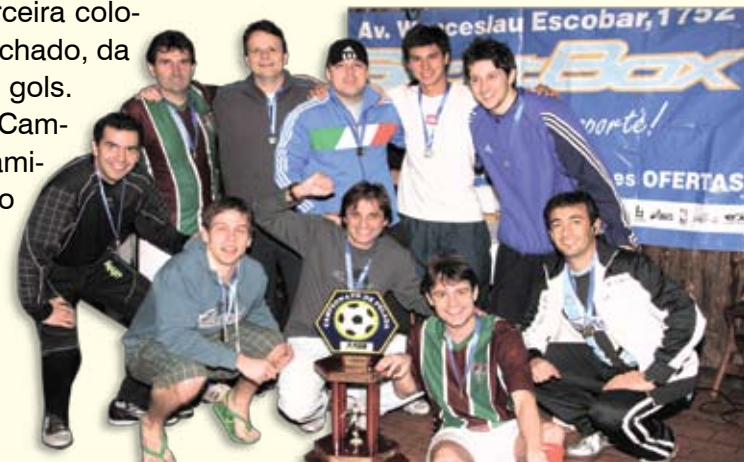
Comemoração ao receber o troféu