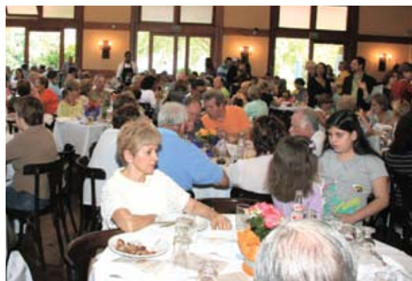
Almoço da Caixinha faz a integração dos Aposentados

De 25 a 28 de agosto, a AABB Porto Alegre promoveu a XII Semana do Aposentado. Além do tradicional Almoço da Caixinha, que encerrou as comemorações em clima de confraternização, a programação contou com diversas atividades esportivas e oficinas de teatro. A edição deste ano comemorou os 12 anos do evento que de encontro dos Aposentados.