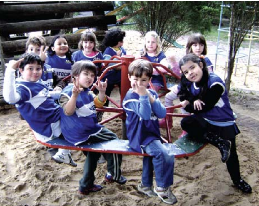
A turminha fervendo durante o AABB Kids inverno

A edição recém terminou e já deixou saudades na criançada. Mas preparem-se que no verão tem mais!