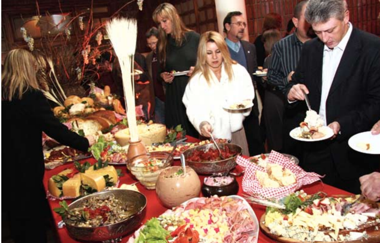
A mesa farta confirmou o sucesso da Noite