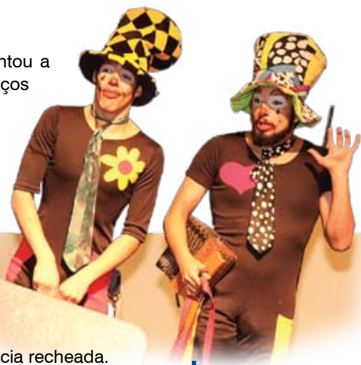
Os palhaços Chico e Mortadela divertiram a criançada

O sucesso desta edição foi tanto que deixou o gostinho de quero-mais em todos os que viveram este momento. E para os que ficaram de fora, ano que vem tem mais!