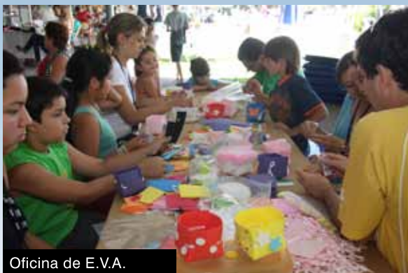
Oficina de E.V.A.

No Núcleo Infantil, a magia de “Quebra Nozes” encantou crianças de todas as idades, que pararam atentamente para assistir ao espetáculo. Com as oficinas de Kirigami e E.V.A., a meninada aprendeu a fazer cartões de Natal e bonecos artesanais. A “Pintura sobre tela”, além de ter sido um grande sucesso, rendeu lindas obras de arte.