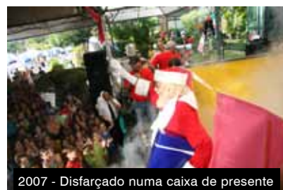
2007 - Disfarçado numa caixa de presente