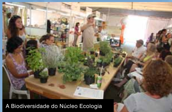
A Biodiversidade do Núcleo Ecologia

O palco de apresentações, ao lado do Ginásio, fez até quem apreciava o Shiatsu, do Núcleo Saúde, parar para assistir. Com três danças – Cigana, Gafieira e Flamenca –, o Espaço Cultural fechou com chave de ouro a agradável tarde de sábado, oferecendo um show de diversão e entretenimento ao público.