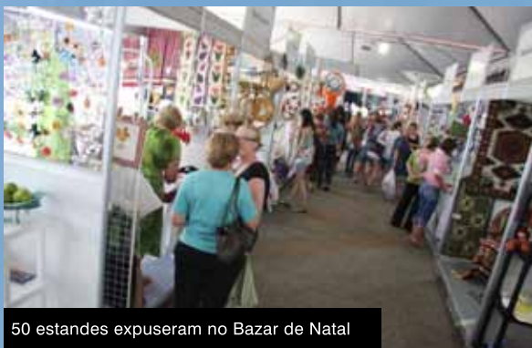
50 estandes expuseram no Bazar de Natal

O caloroso sábado do dia 27 de novembro reuniu pessoas de todas as partes de Porto Alegre para um ambiente de lazer, cultura e muita diversão. A décima quarta edição do Sábado e Domingo de Qualidade da AABB, que aconteceu nos dias 27 e 28 de novembro, abriu as suas portas para um universo de holística, educação, ecologia e saúde.