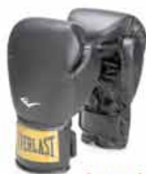
Luva de boxe