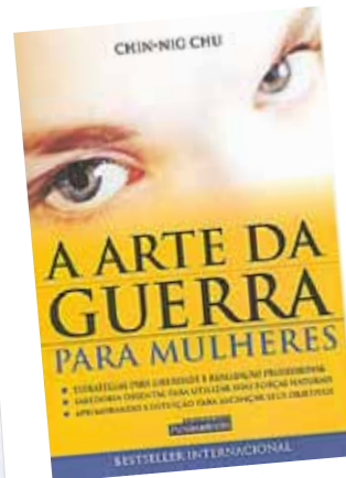
A arte da guerra para mulheres Examina estratégias para a conquista da liberdade e do sucesso pessoal e profissional.