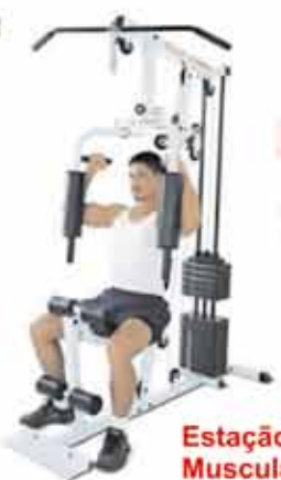
Estação de Musculação