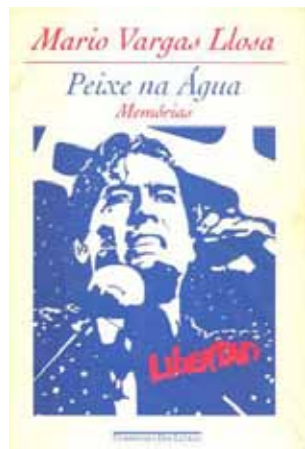
Peixe na Água: Memórias Memórias do Nobel de Literatura 2010, Mario Vargas Llosa.