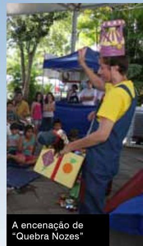
A encenação de “Quebra Nozes”