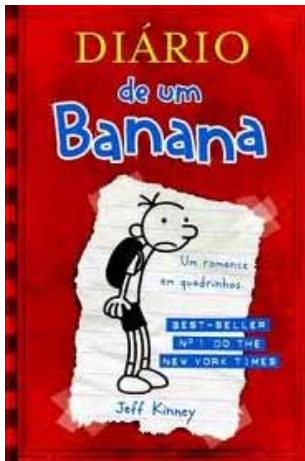
Diário de um Banana 1, 2 e 3 O cômico dia a dia de Greg, contado em seu diário. Espie você também!