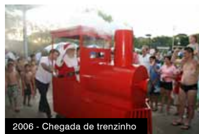
2006 - Chegada de trenzinho