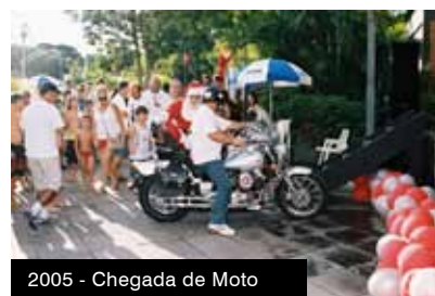
2005 - Chegada de Moto

As imagens poderão ser enviadas para o email: promemoria@aabbportoalegre.com.br